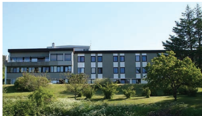
Mork rehabiliteringssenter er en del av den spesialiserte rehabiliteringstjenesten i Helse Møre og Romsdal.

– Ja! Det er spennende, lærerikt og utviklende å være involvert og ha innvirkning på det som skjer på arbeidsplassen.