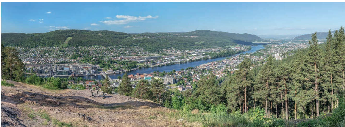
Drammen er en by og kommune i Viken fylke. Kommunen er Norges syvende største i folketall, og Drammensregionen er en del av storbyregionen omkring Oslo.

- Vi startet med én barneergoterapeut i nye Drammen med over 100 000 innbyggere. Jeg har jobbet målrettet for å få økte ressurser på dette området fra dag én som tillitsvalgt. Mitt beste minne er den dagen vi fikk beskjed om at vi kunne lyse ut ny, fast stilling som barneergoterapeut. Jeg jobber fortsatt for flere faste stillinger.